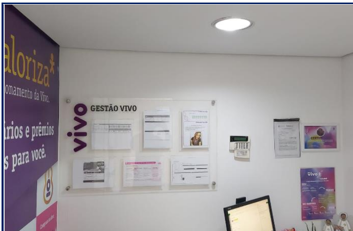
Local antes da instalação