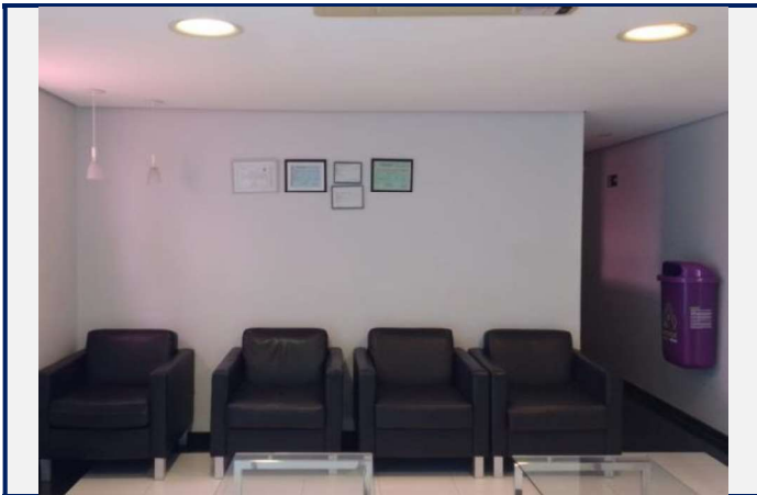
Local antes da instalação