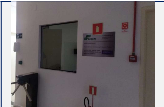
Local antes da instalação