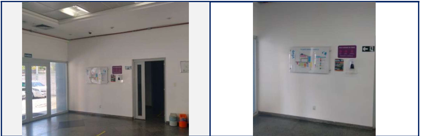
Local antes da instalação