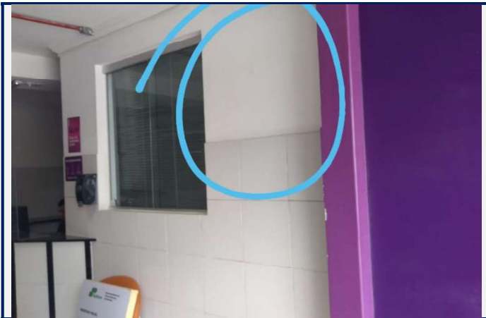
Local antes da instalação